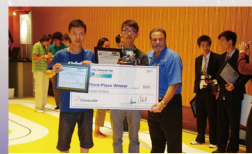
我校学子在“飞思卡尔”杯全球大学生智能汽车总决赛现场