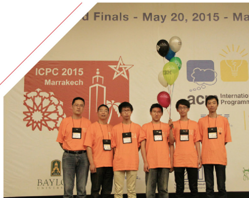
我校代表队在 ACM 全球总决赛上获佳绩