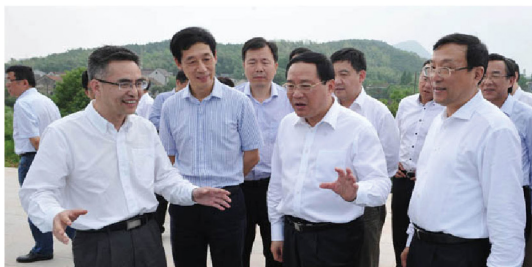
李强省长在王兴杰书记、薛安校校长陪同下视察我校青山湖校区