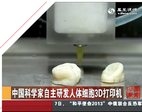
中国科学家自主研发人体细胞3D打印机 7日, “和平使命2013”中俄联合反恐军 我校科研团队成功研制国内首款可打印生物材料和活细胞的3D打印机