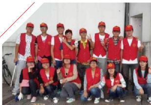
校志愿者用烟头拼出“无烟西湖” 号召文明旅游

以上英语成绩按单科总分150分计, 具体按各省普通高考实际英语单科总分等比例换算。