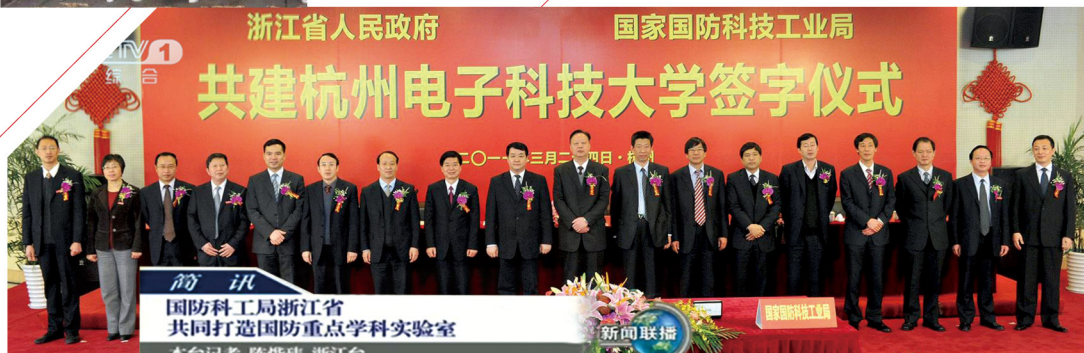
共建杭州电子科技大学签字仪式